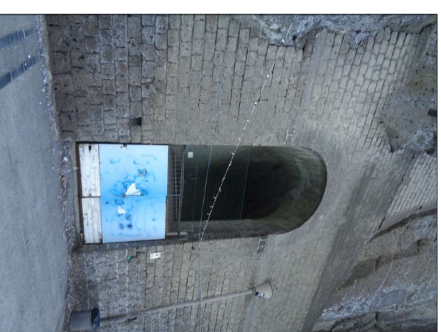
foto 2: veduta dell'ingresso dalla passeggiata Via Naviganti Metesi

Impianto distributivo urbanistico: - grotta/deposito scavata nel tufo della falesia, con ingresso dalla berma comunale - Via Naviganti Metesi